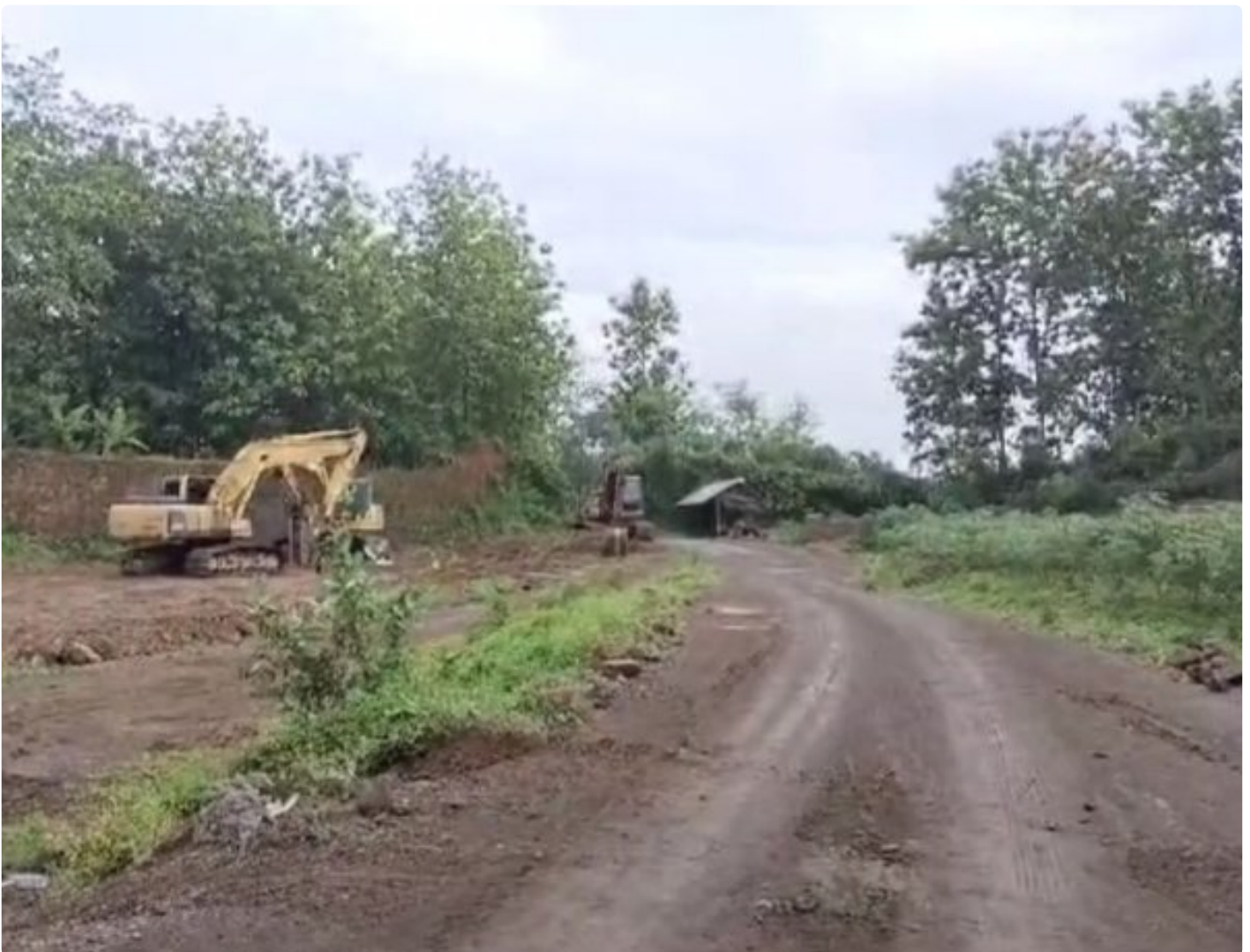
Foto: Tambang galian C di Desa Sumbermulyo, Kecamatan Tlogowungu, Kabupaten Pati, Jawa Tengah.

PATI - Cabang Dinas ESDM Wilayah Kendeng Muria kembali menjadi sorotan. Tambang galian C di Desa Sumbermulyo, Kecamatan Tlogowungu, diduga beroperasi tanpa izin selama hampir lima tahun. Ironisnya, aktivitas ini